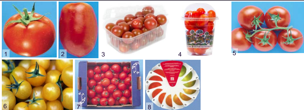
Фото 1: круглый томат Фото 2: томат сливка Фото 3,4: томаты черри Фото 5: томаты на ветке Фото 6: желтые томаты Фото 7: вариант упаковки (навал) Фото 8: 12-балльная шкала зрелости