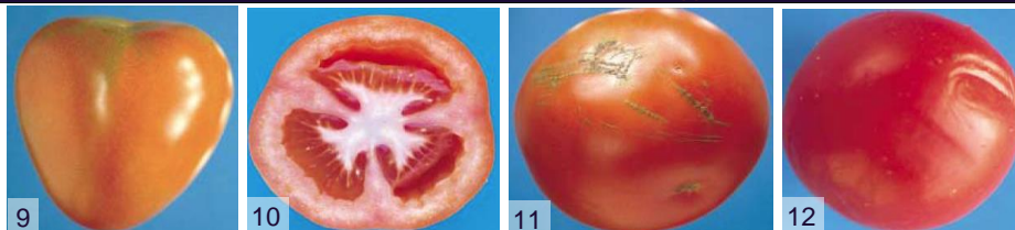
Фото 9: дефект формы Фото 10: незначительная пустотелость семенной камеры Фото 11: небольшие зарубцевавшиеся царапины Фото 12: незначительная помятость