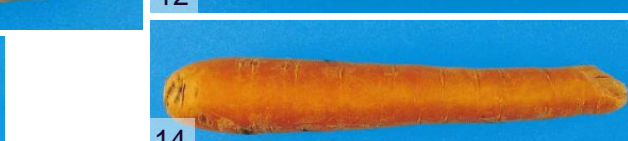
Фото 9: плохо промытая Фото 10: одревеневшая сердцевина Фото 11: начальные признаки прорастания Фото 12: существенные трещины Фото 13: уродливая форма Фото 14: отломанный кончик