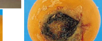
Фото 15: увядшая морковь Фото 16: проросшая морковь Фото 17,18: повреждения вредителями Фото 19: загнившая