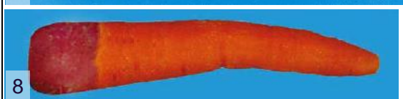
Фото 4: дефекты формы Фото 5: дефект окраски Фото 6: не доходящие до сердцевины трещины Фото 7: следы потертости Фото 8: лиловая часть верхушки