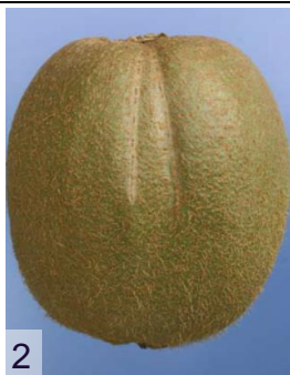
Фото 2: киви 2 категории