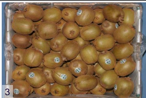
Фото 3: вариант упаковки (навал 10 кг)