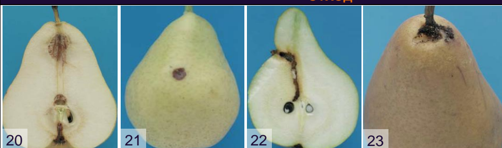
Фото 20: побурение мякоти Фото 21: загнивший плод Фото 22, 23: повреждения от насекомых