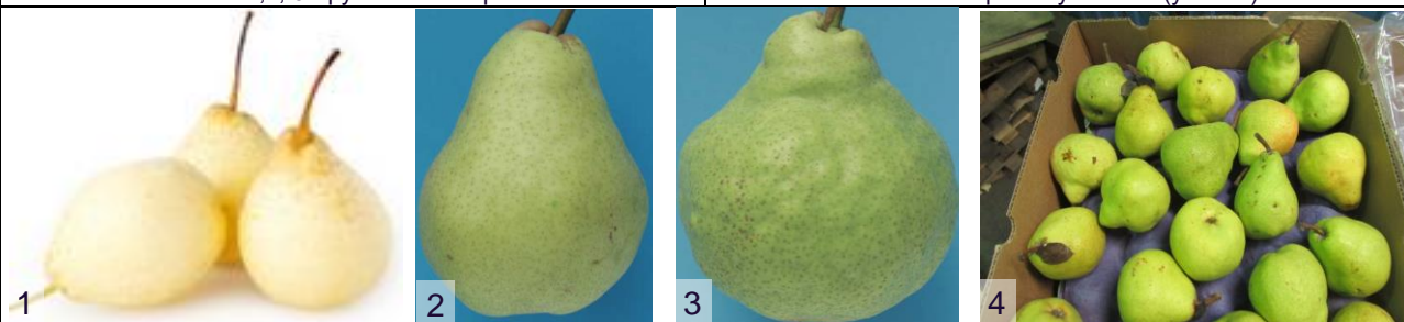
Фото 4: вариант упаковки (уложка)